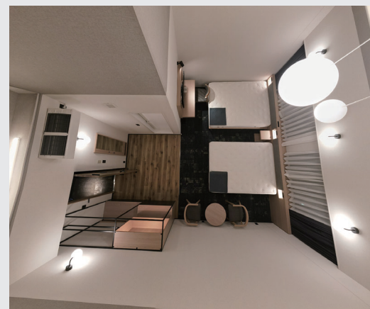
ドローンによる天井部から撮影した客室