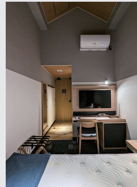
コンパクトでありながら高い天井を備えた シングルルーム