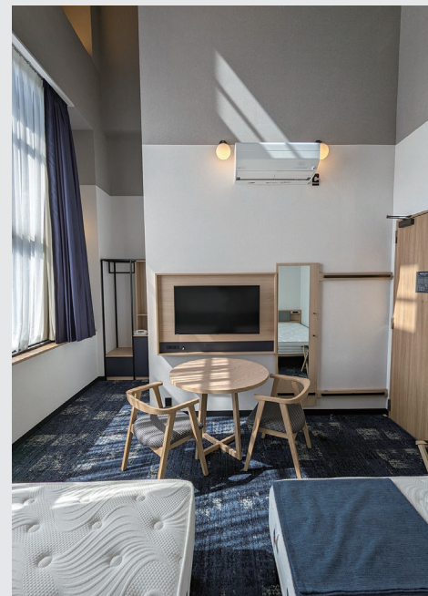
大きな窓を備えた解放感のある ダブルルーム